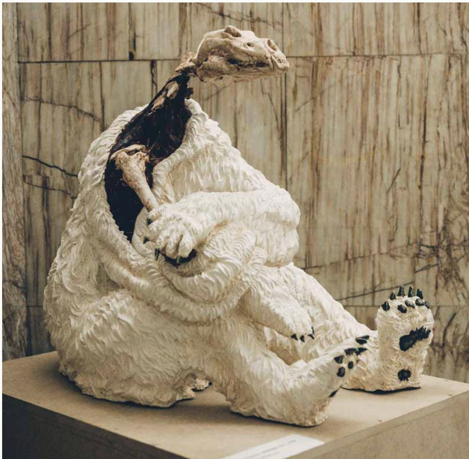
MICHAL NAGYPÁL MEDVĚD

2017 60 x 80 x 65 cm LAMINÁT