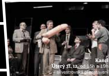
Kancl Úterý 31. 12. od 15h a 19h – silvestrovská představení

Změna programu vyhrazena. ◊ Označení předplatitelské skupiny. Na tato představení je možné zakoupit vstupenky. ◊ Prohlídka zákulisí po představení. * Tyto akce nejsou v režii Městských divadel pražských. ** Představení odehraná v rámci Vánočního festivalu. MS Označení představení na Malé scéně ABC.