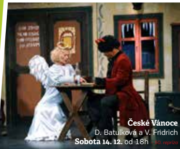
České Vánoce D. Batulková a V. Frídřich Sobota 14. 12. od 18h 50. repríza

Bedřich Smetana: The Greatest Hits Pardubice, čtvrtek 12. 12. od 19h