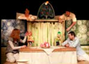
Maruška a duch Vánoc

19 h České Vánoce Městská divadla pražská (Divadlo ABC)