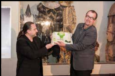
Dort v rukách vedení Městských divadel pražských