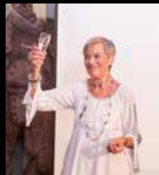
Na zdraví, paní Lubo!