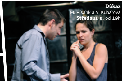
Důkaz M. Písařík a V. Kubařová Středa 11. 9. od 19h

Úsměv Dafné Choceň, čtvrtek 26. 9. od 1930h