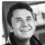
Aleš Procházka herec