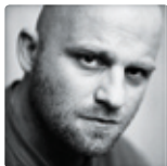
Hynek Čermák herec