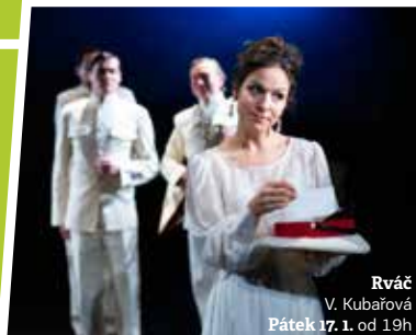
Rváč V. Kubařová Pátek 17. 1. od 19h

Bedřich Smetana: The Greatest Hits Jičín, úterý 28. 1. od 19h