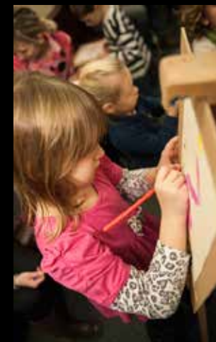
Malování na malířských stojanech s ateliérem Malování kreslení, o. s.