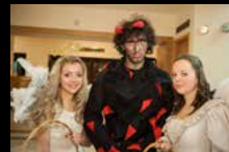
Andělsko-čertovský nadílkový tým