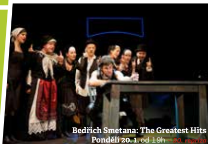
Bedřich Smetana: The Greatest Hits Pondělí 20. 1. od 19h – 50. repríza