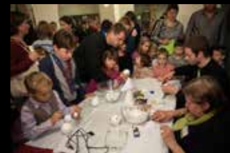
Výroba ozdob z polystyrenových koulí