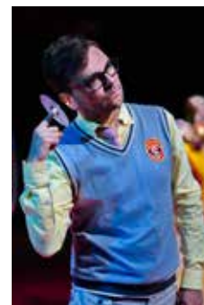
Drž mě pevně, miluj mě zlehka