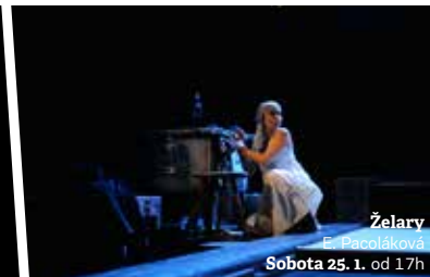
Želary E. Pačoláková Sobota 25. 1. od 17h