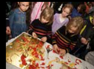
Výroba vánočních ozdob z voskových plátů