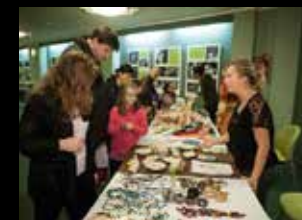
Stánky neziskových organizací