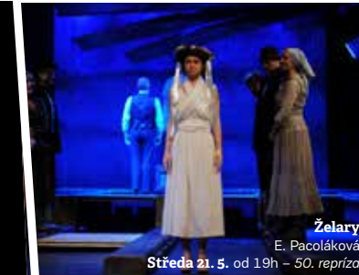
Želary E. Pacoláková Středa 21. 5. od 19h – 50. repríza