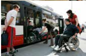
Terapie v terénu

Vypněte své mobilní telefony, představení právě začíná. Opona se zvedá, herci vcházejí na scénu. Návštěvníci divadla sedí na svých místech a mohou si vychutnat dvě hodiny kulturního zážitku. Pro klienty Centra Paraple je návštěva divadla zážitek hned dvojnásobný. Upoutání na ortopedický vozík po úrazu či nemoci musí den co den zdolávat množství bariér. Nyní si ale můžou vyzkoušet, že s dostatečnou motivací a s pomocí doprovodu, dokážou všechny překážky úspěšně překonat a mohou si užít krásný společenský večer.