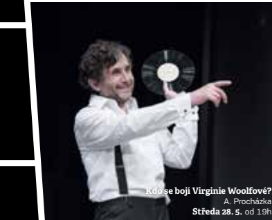
Kdo se bojí Virginie Woolfové? A. Procházka Středa 28. 5. od 19h

Změna programu vyhrazena. Označení předplatitelské skupiny. Na tato představení je možné zakoupit vstupenky. Prohlídka zákulisí po představení. * Tyto akce nejsou v režii Městských divadel pražských. Označení představení na Malé scéně ABC.