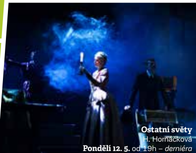
Ostatní světy H. Hornáčková Pondělí 12. 5. od 19h – deniéra