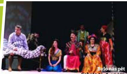
Bylo nás pět Sobota 24. 5. od 19h