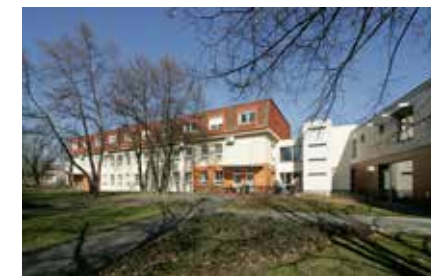
Budova Centra Paraple