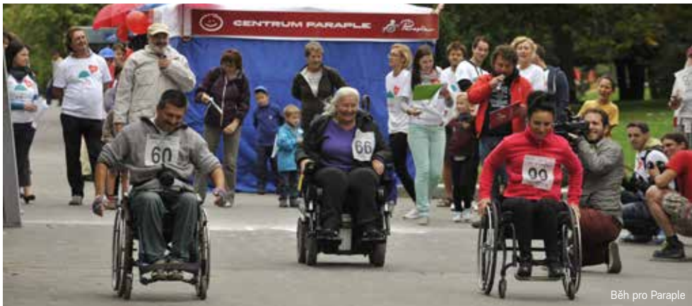
Běh pro Paraple