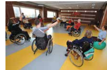
Centrum Paraple - Velká tělocvična