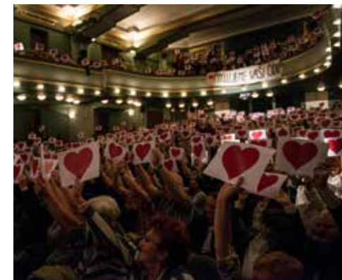
500 srdíček od diváků a transparent