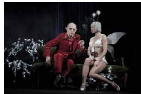
Sen čarovné noci