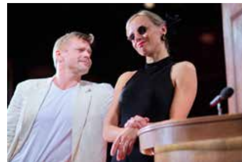
Drž mě pevně, miluj mě zlehka