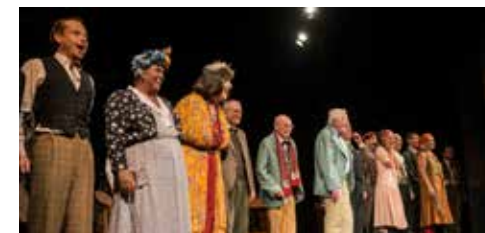
Údiv herců při srdíčkovém překvapení