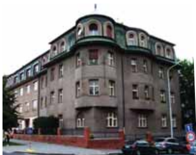
Dům v ulici Tychonova