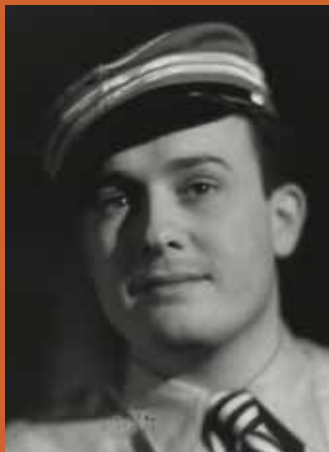
Jiří Voskovec, 30. léta 20. století