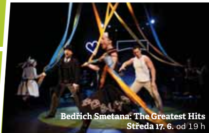
Bedřich Smetana: The Greatest Hits Středa 17. 6. od 19 h