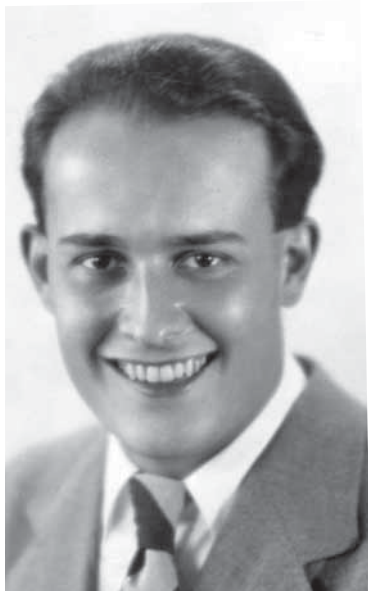
Jiří Voskovec v roce 1928