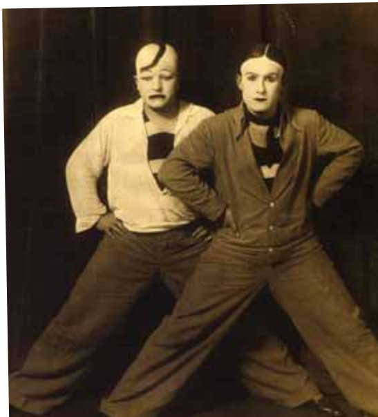
Foto z inscenace Sever proti jihu, J. Werich a J. Voskovec jako neutrální Vilém Tell a Gala Petr