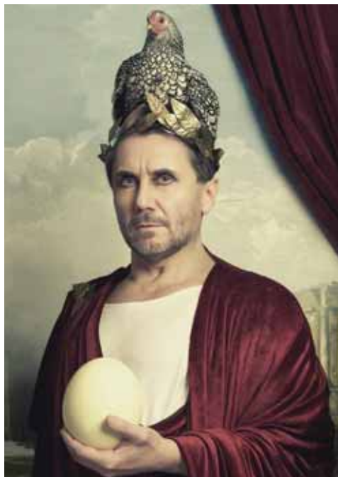
Plakát k inscenaci Romulus Veliký

Je to prototyp antihrdiny. V dobách válečných, v dobách dobývání a rozdělování světa zastává pacifistické názory a více než politika ho zajímá chov slepic, jejichž snůšku s chutí pojídá a zapíjí vínem z jím vypěstovaného chřestu. Současná doba je charakteristická absencí velkých, tragických hrdinů a k vykreslení dnešního světa plného tragiky, neukotvenosti a chaosu se lépe hodí hrdina groteskní, byť svým smýšlením nebezpečný. Romulus je hluboce nespokojen se světem, ve kterém žije a rozhodne se ho za každou cenu změnit. Navíc pouhou destrukcí. Tím se zákonitě stává smrtelně nebezpečným pro všechny lidi, kteří se snaží žít co nejlépe svůj každodenní život bez velkých vizí a ideálů, neboť přijímají svět takový, jaký je, a moudře vědí, že změnit nelze.