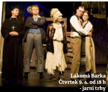
Lakomá Barka Čtvrtek 9. 4. od 18 h -jarní trhy