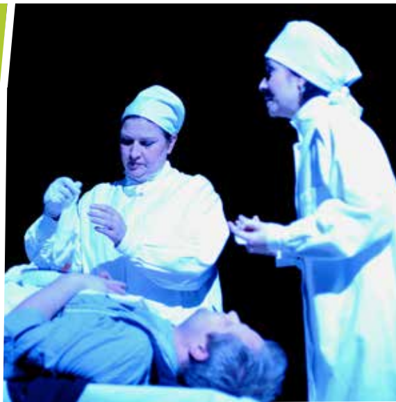
Z inscenace Želary