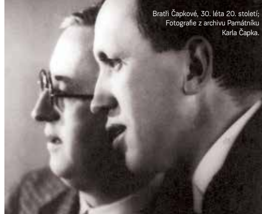
Bratři Čapkové, 30. léta 20. století; Fotografie z archivu Památníku Karla Čapka.