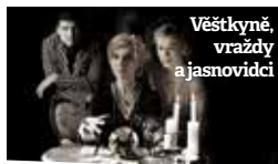
Věštkyně, vraždy a jasnovidci