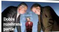
Dobře rozehraná partie