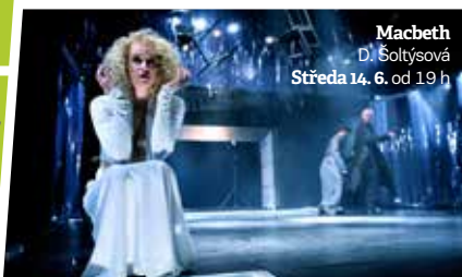
Macbeth D. Šoltýsová Středa 14. 6. od 19 h