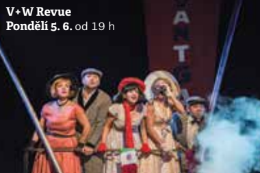
V+W Revue Pondělí 5. 6. od 19 h