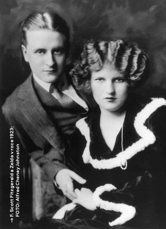
→ F. Scott Fitzgerald a Zelda v roce 1923

Fitzgerald odjel do Hollywoodu s nadějí, že se prosadí jako filmový scenárista, brzy ale zjistil, že tvorba scénářů se výrazně liší od psaní románů a povídek. Nedokázal se v tomto prostředí uchytit, přesto zůstal, částečně i kvůli vztahu s mladou herečkou Lois Moranovou. Po osmi letech usilovné práce a opakovaném přepisování nakonec vydal v roce 1934 čtvrtý román Něžná je noc silně inspirovaný zkušenostmi s jeho duševně nemocnou manželkou. Fitzgerald byl stále pod obrovským finančním tlakem. Kromě vysokých nákladů na Zeldinu léčbu musel financovat i prestižní vzdělání jejich dcery a zároveň bojoval se svou závislostí na alkoholu. Povídky už nepsal s takovou lehkostí jako dříve a honoráře za ně nestačily pokrýt narůstající dluhy. Situace dolehla i na Zeldu, která se několikrát pokusila o sebevraždu. Ačkoliv spolu manželé posledních roků netrávili, nikdy se oficiálně nerozvedli. Fitzgerald měl novou partnerku, bulvární reportérku Sheilah Grahamovou, se Zeldou si ale nepřetržitě dopisoval a finančně ji podporoval. V roce 1940 Fitzgerald zemřel na srdeční infarkt uprostřed práce na svém posledním románu. Kniha vyšla posmrtně v roce 1941 pod názvem Poslední magnát .