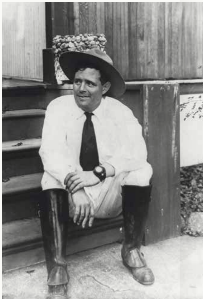
Jack London v roce 1916

Mezi zlatokopy Jack London sice nezbohatl a nenávratně si poškodil zdraví, ale načerpal životní zkušenosti, které se staly námětem jeho nejslavnějších povídek a románů. Podle