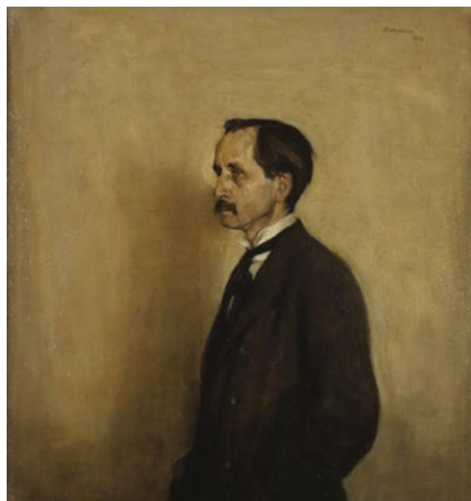
Sir James Matthew Barrie (Sir William Nicholson, 1904)