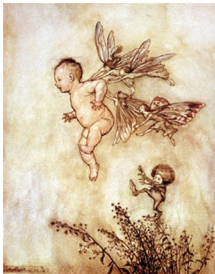
Ilustrace A. Rackhama z Peter Pan in Kensington Gardens (1906)