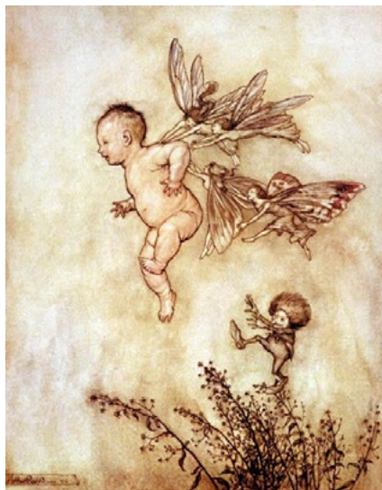
Ilustrace A. Rackhama z Peter Pan in Kensington Gardens (1906)