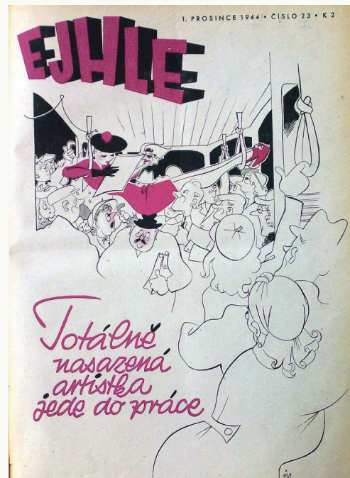
Titulní strana protektorátního kolaborantského satirického čtrnáctideníku Ejhle z prosince 1944