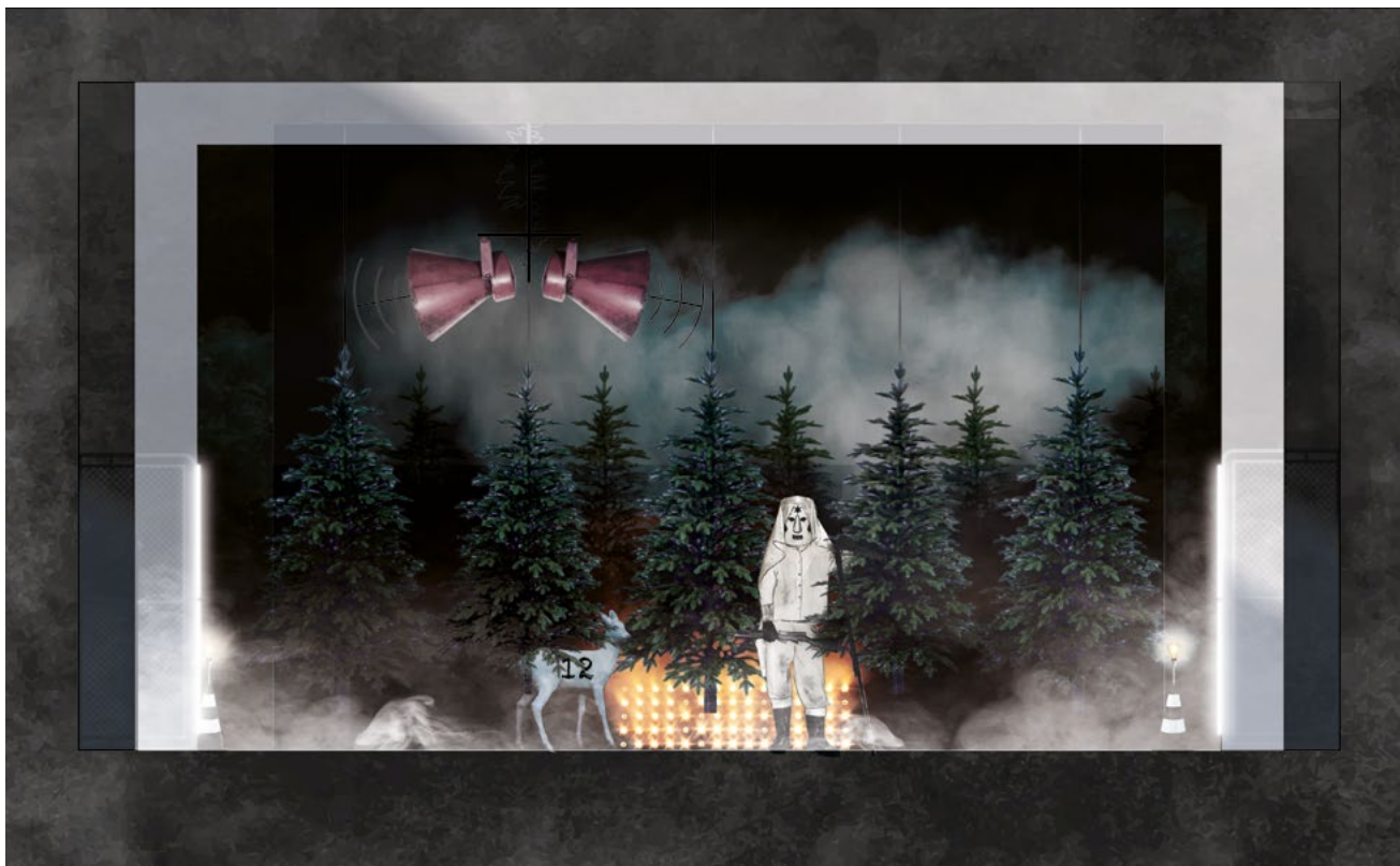
Scénografické návrhy Petra Vítka

V další větě následuje spoiler – spoiler je část díla, která vyrazuje zápletku nebo rozuzlení jiného díla, v tomto případě Löhleho hry Přes čáru . Spoilery lze najít třeba v recenzích, na Wikipedii ve člancích o filmech, knihách, divadelních hrách apod. Stalo se nepsaným zvykem, že autor před takovým spoilerem čtenáře varuje, aby ho mohli přeskóčit, což právě teď jako autor této poznámky činím. To vede k několika možnostem jednání v závislosti na vašem mentálním nastavení: 1) inscenaci jste neviděli a chcete se nechat překvapit, pak nebudete pokračovat ve čtení, 2) inscenaci jste neviděli, ale o překvapení z děje vám nejde, tedy pokračujete ve čtení, 3) inscenaci jste neviděli a ani vidět nechcete a pak tuto poznámku vůbec nepřečtete a všechno je tak v zásadě jedno.